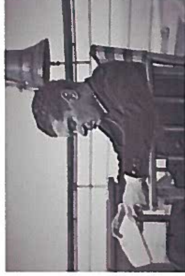
1933: Natalino Otto sulla T/B "Conte di Savoia"

Il conferimento dell' ATTESTATO ENTEL 2018 ALLA MEMORIA vuole testimoniare le origini dell'Artista: la LIGURIA si onora di aver dato i natali al musicista, cantante, autore, editore, produttore NATALINO OTTO , e lo ringrazia per il suo immensa, originale, indimenticabile contributo al mondo dello spettacolo italiano."